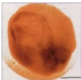
Mit Synchrotronstrahlung geröntgtes rotes Blutkörperchen, das von einem Malaria-Parasiten befallen ist.

„Mit der von Heidenreich & Harbeck gelieferten Qualität sind wir sehr zufrieden“, resümiert Bessy-Ingenieur Bäcker in der Messhalle, wo UE46 an einer 6 m langen Messbank aus geschliffenem Granit mit modernster Messtechnik einjustiert wird.