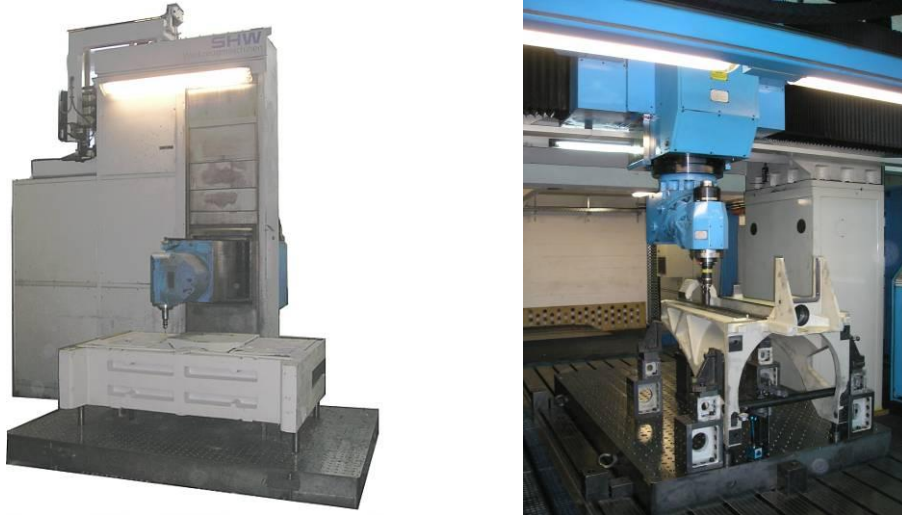
Abbildung 1 Fahrständer- und Genauigkeits-Portalfräsmaschine

In konstruktionsrelevanten Internetforen taucht häufig die Frage auf, ob in einer technischen Zeichnung für die Oberflächengüte die Rauheitsangabe Ra oder Rz eingetragen werden muss bzw. welche dieser Angaben zu bevorzugen ist. Für Gusseisenwerkstoffe empfiehlt sich die Vorgabe der mit definierter Schneide zu erzeugenden Oberflächengüte mit Ra-Werten , wie im Folgenden erläutert wird.